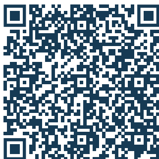
Бобышки для резервуарного оборудования