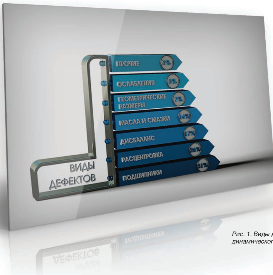
Рис. 1. Виды дефектов динамического оборудования

Базы статистических данных формировались с помощью портативных измерительных средств технической диагностики при ежемесячных обследованиях механического и энергетического оборудования: