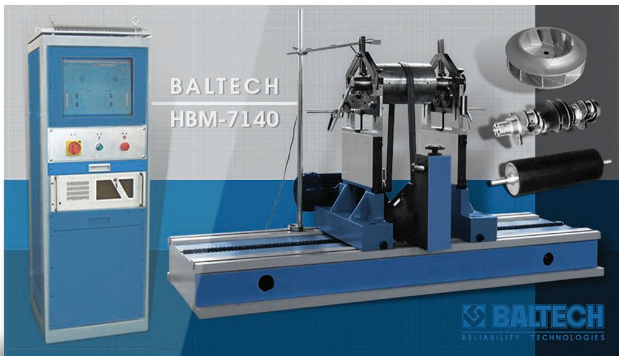
Рис. 2. Горизонтальный балансировочный станок BALTECH HBM

портативными мини-лабораториями, перейти на другой тип мазок, заменить типы уплотнений и установить стационарную систему автоматической смазки, которая позволяет в 3–4 раза сократить годовой объем используемых смазочных материалов за счет точного дозирования.