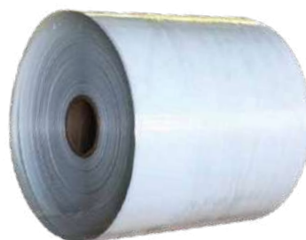
АТП лента – стеклопластиковая однаправленная армированная лента