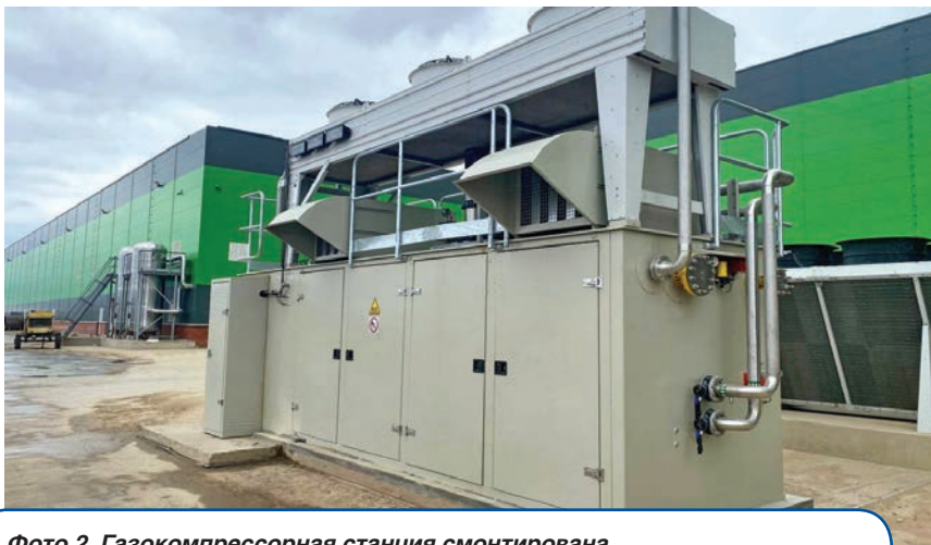
Фото 2. Газокомпрессорная станция смонтирована на эксплуатационной площадке нового предприятия

Технологическая схема ДКС гарантирует устойчивое поддержание расчетной температуры топлива, необходимой для нормальной работы турбины. Линия нагнетания станции оборудована теплообменным аппаратом, который охлаждает рабочую среду и обеспечивает оптимальную температуру подачи газа (до +70°C), определенную производителем ГТУ и условиями проекта.