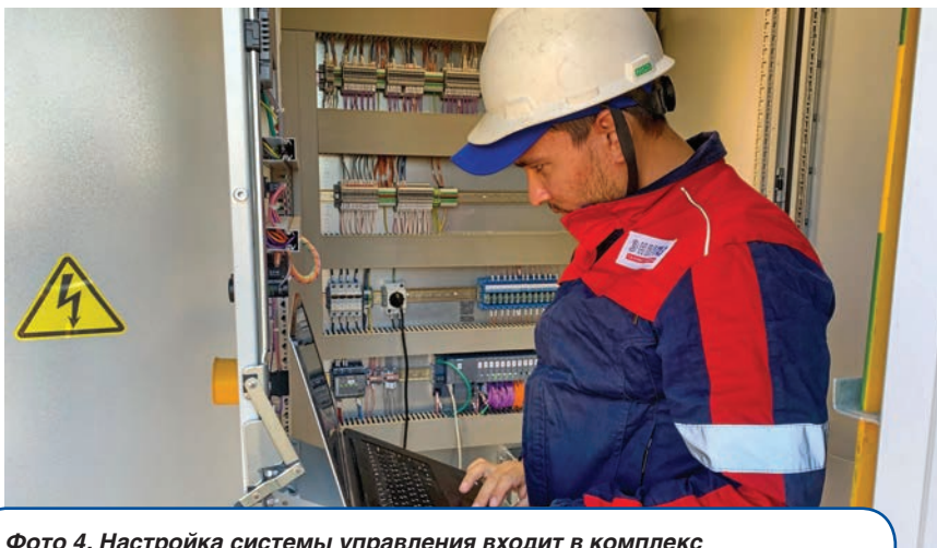
Фото 4. Настройка системы управления входит в комплекс пусконаладочных работ

Техническое сопровождение всех проектов осуществляет компания СервисЭНЕРГАЗ, входящая в Группу ЭНЕРГАЗ. Сервисные инженеры выполняют полный цикл предпусковых мероприятий: шефмонтаж, наладку, собственные и интегрированные испытания, обучение персонала.