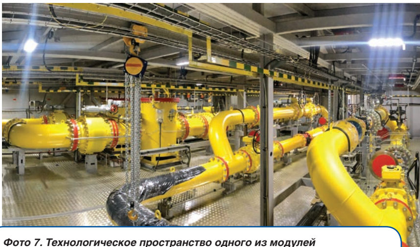
Фото 7. Технологическое пространство одного из модулей газорегуляторного пункта «ЭНЕРГАЗ»

Система фильтрации, изготовленная и поставленная на объект компанией ЭНЕРГАЗ, предназначена для удаления твердых частиц и влаги из магистрального газа высокого давления (3,1...5,4 МПа) и состоит из трех фильтров-сепараторов пропускной способностью по 72 600 м 3 /ч. Система включает две работающие линии и одну резервную.