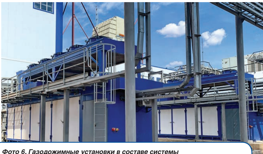
Фото 6. Газодожимные установки в составе системы топливоснабжения нового энергоблока

В связи с планируемым ростом потребления топлива здесь модернизируется схема внешнего газоснабжения – осуществляется строительство подводящего трубопровода высокого давления и реконструкция газораспределительной станции (ГРС) «Белоозерск-2». Реконструкция предполагает демонтаж существующего узла очистки газа, установку новой системы газовой фильтрации и увеличение проектной производительности ГРС до 145 200 м 3 /ч.