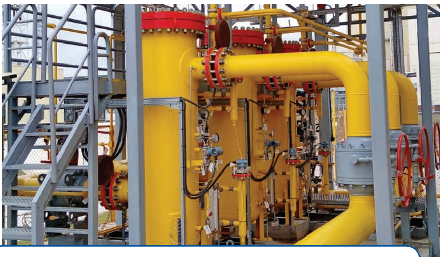
Фото 8. Высокоэффективная система газовой фильтрации

ООО «ЭНЕРГАЗ» 105082, Москва, ул. Б. Почтовая, 55/59, стр. 1 тел. (495) 589-36-61 факс (495) 589-36-60 e-mail: info@energaz.ru www.energaz.ru