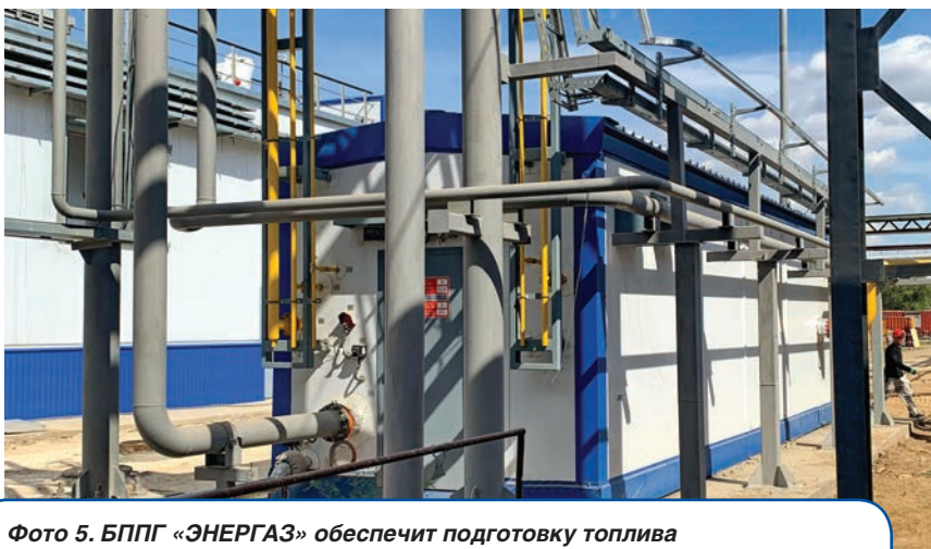
Фото 5. БППГ «ЭНЕРГАЗ» обеспечит подготовку топлива для газотурбинной установки Актюбе ТЭЦ

Пункт подготовки газа и дожимная компрессорная станция полностью автоматизированы. Их системы управления выполнены на базе микропроцессорной техники с использованием современного