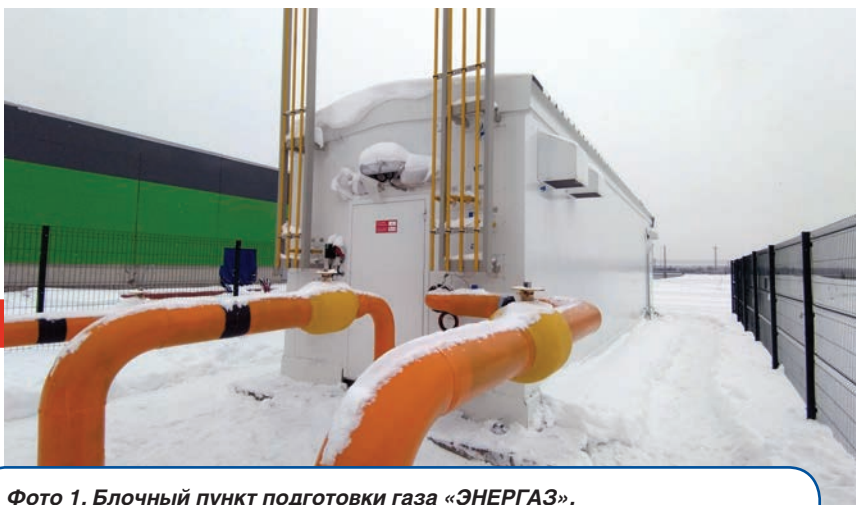
Фото 1. Блочный пункт подготовки газа «ЭНЕРГАЗ», действующий на энергоцентре завода НАУАТ

БППГ (фото 1) с пропускной способностью 9 317 \text{нм}^3/\text{ч} служит для учета, фильтрации, редуцирования и контроля качества газа. Эта технологическая установка введена в эксплуатацию и на данном этапе (до пуска ГТУ) обеспечивает топливом котельную энергоцентра.